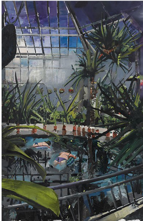
Marius Bercea, The Botanists , 2015, ulei pe panza, 85 x 130 cm.

Piscine amplasate in mijlocul unei sere coplesite de vegetatie luxurianta sau al unei gradini acoperite de un luminator modernist, personaje care par sa inainteze printre decorurile unei productii cinematografice sau sa fie ultimii supravietuitori ai unor dezastre, ritualuri intr-un decor straniu, deopotriva magic si amenintator – cu lucrarile sale recente, Marius Bercea adauga noi dimensiuni „Transylforniei“, colajul vizual si simbolic ce-l preocupa de cativa ani.