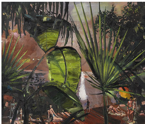
Marius Bercea, Body Toner Satire , 2015, ulei pe panza, 160 x 190 cm.

Piscine amplasate in mijlocul unei sere coplesite de vegetatie luxurianta sau al unei gradini acoperite de un luminator modernist, personaje care par sa inainteze printre decorurile unei productii cinematografice sau sa fie ultimii supravietuitori ai unor dezastre, ritualuri intr-un decor straniu, deopotriva magic si amenintator – cu lucrarile sale recente, Marius Bercea adauga noi dimensiuni „Transylforniei“, colajul vizual si simbolic ce-l preocupa de cativa ani.